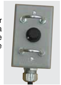
La DLW400ESA permite que dos operadores puedan soldar simultáneamente — cada uno con su propio control remoto.

El control remoto opcional permite al operador ajustar el amperaje hasta 100 pies de distancia de la máquina. La DLW400ESA permite que dos operadores puedan soldar simultáneamente cada uno con su propio control remoto.