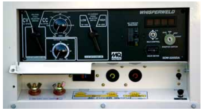
Instrumentación completa incluyendo los controles para ambas soldaduras de CC y CV.