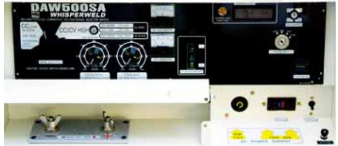
Instrumentación completa incluye voltímetro CD y amperímetro.