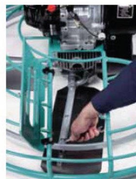
Pannello apribile per un veloce e facile accesso alle pale