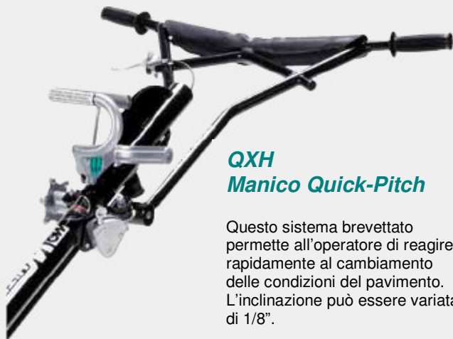
QXH Manico Quick-Pitch

La presa migliore. Il nostro nuovo manico riduce notevolmente le vibrazioni trasmesse all'operatore. Questo manico è regolabile in altezza per incrementare il comfort dell'operatore e ridurre la fatica. Caratteristica sia sul modello standard che sul modello Quick-Pitch.