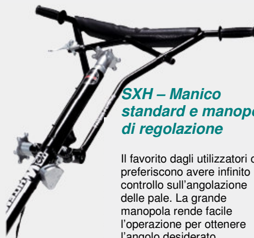
SXH - Manico standard e manopola di regolazione

Questo sistema brevettato permette all'operatore di reagire rapidamente al cambiamento delle condizioni del pavimento. L'inclinazione può essere variata di 1/8".