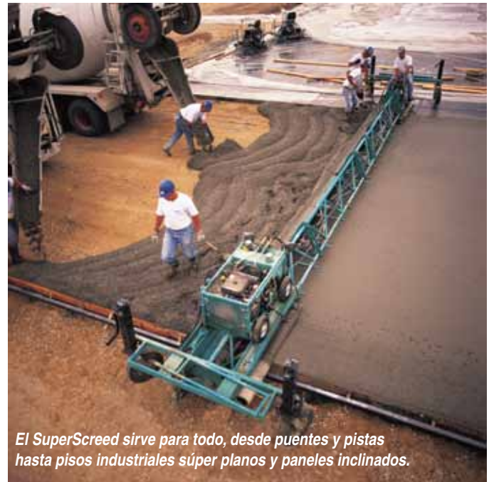
El SuperScreed sirve para todo, desde puentes y pistas hasta pisos industriales súper planos y paneles inclinados.