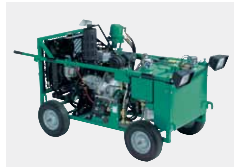
Fuente de energía diesel Vanguard con enfriamiento por líquido de 28 HP