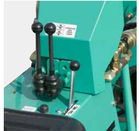
Se hacen correcciones de alineamiento precisas con controles de dirección hidráulica independientes fáciles de usar. Aparece con controlador para motor a gasolina.