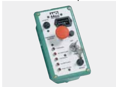
El panel de control del motor diesel proporciona toda la información vital con solo echar un vistazo.