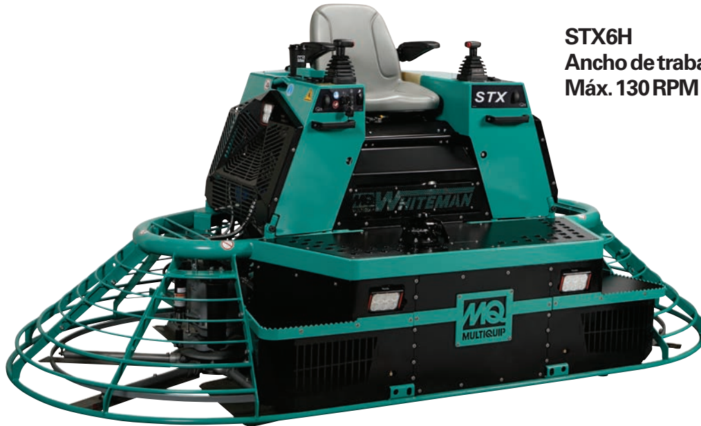
STX6H Ancho de trabajo de 297 cm Máx. 130 RPM

La allanadora de operador a bordo serie STX es líder en la industria cuando se trata de producir la máxima planeidad del suelo. Beneficios esperados por los contratistas y entregados por el líder en la industria