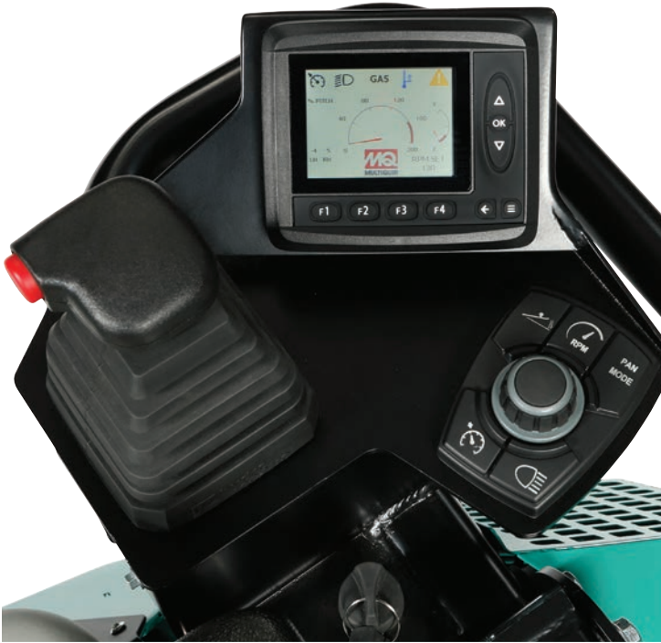
Panel de control de la STXDF